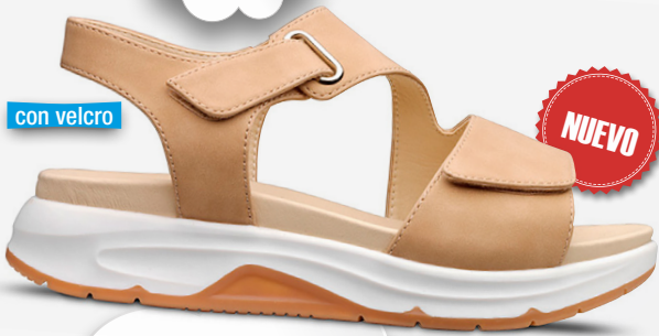
ADARA Ref. 20702

Color: Cuero Alto tacón: 3 Ancho: 5 Tallas: del 36 al 41