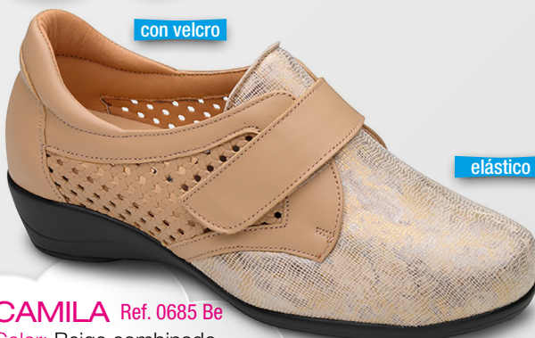
CAMILA Ref. 0685 Be

Color: Beige combinado Alto tacón: 3 Ancho: 6 Tallas: del 35 al 42