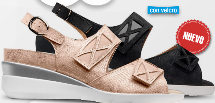
JULIA Ref. 20671

Color: Marrón y negro Alto tacón: 3,5 Ancho: 5 Tallas: del 35 al 41