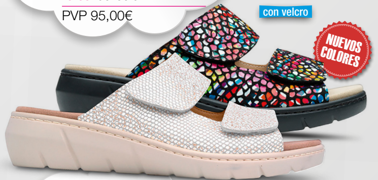
ÁNGELA Ref. 20638

Color: Beige y multicolor Alto tacón: 2,5 Ancho: 5 Tallas: del 35 al 42