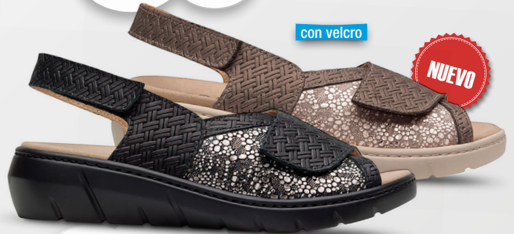
VANESA Ref. 20673

Color: Combinado negro y combinado marrón Alto tacón: 2,5 Ancho: 5 Tallas: del 35 al 42