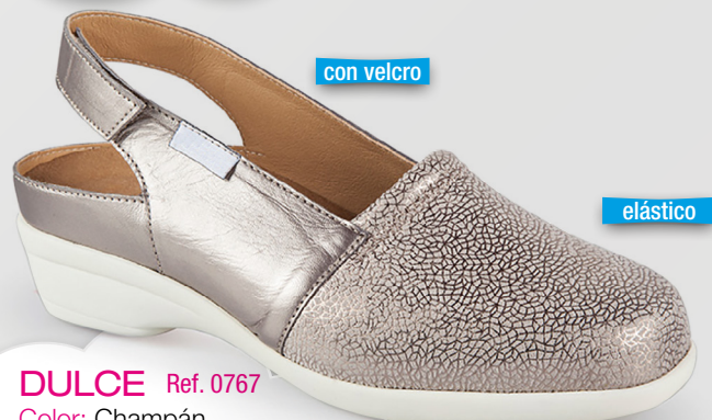
DULCE Ref. 0767

Color: Champán Alto tacón: 3 Ancho: 6 Tallas: del 35 al 41