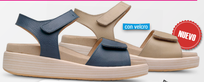
VALERIA Ref. 20689

Color: Azul y beige Alto tacón: 2,5 Ancho: 5 Tallas: del 36 al 42