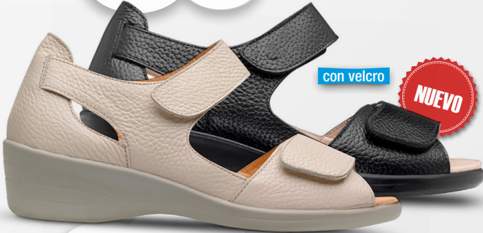
MODES Ref. 20697

Color: Beige y negro Alto tacón: 2,5 Ancho: 5 Tallas: del 35 al 42